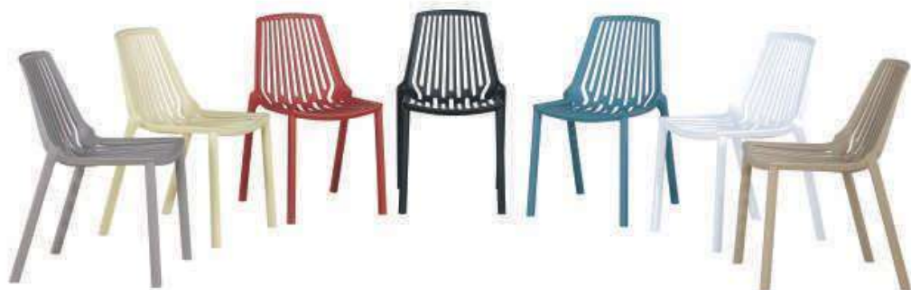
Model: ZH-8088 Size: L55xW46.5xP44.5xH79.5cm