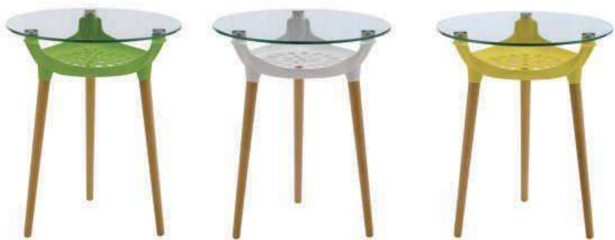
Model:ZH-686玻璃桌 Size: \phi 60xH75cm