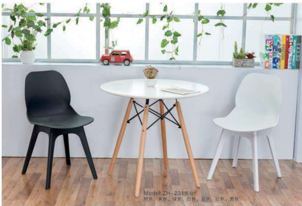
Model:ZH-231复合 棕色、黄色、绿色、白色、蓝色、红色、黑色