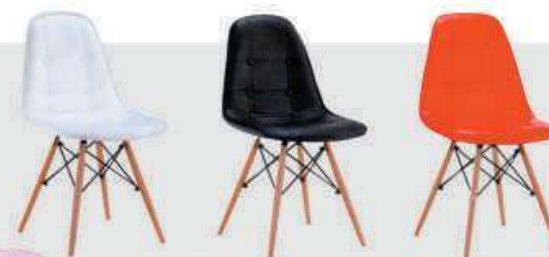
Model:ZH-8056PUM Size:L53.5xW47xH85.5cm SH48cm