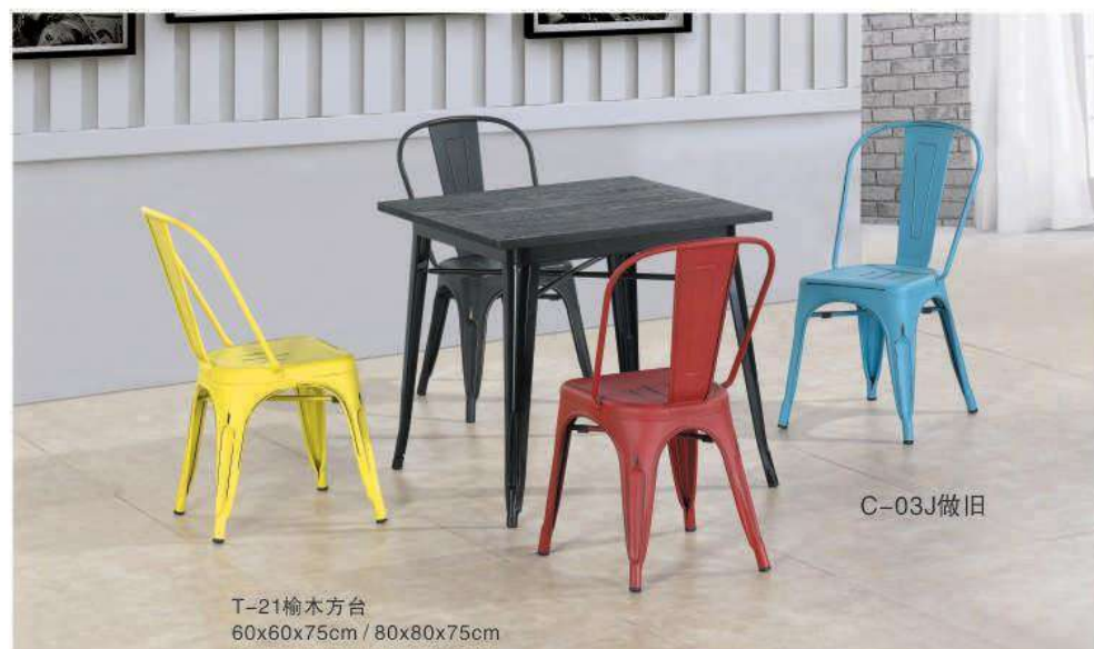
T-21榆木方台 60x60x75cm / 80x80x75cm