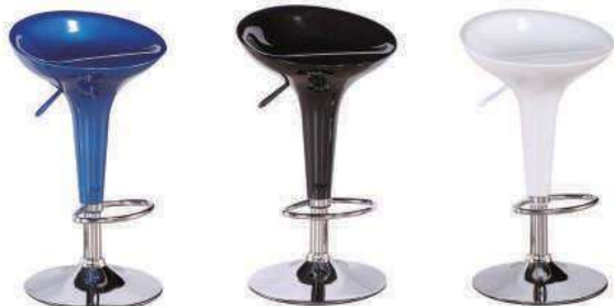
ZH-314 大红、酒红、黑、白、绿、橙、中黄、银灰、宝兰