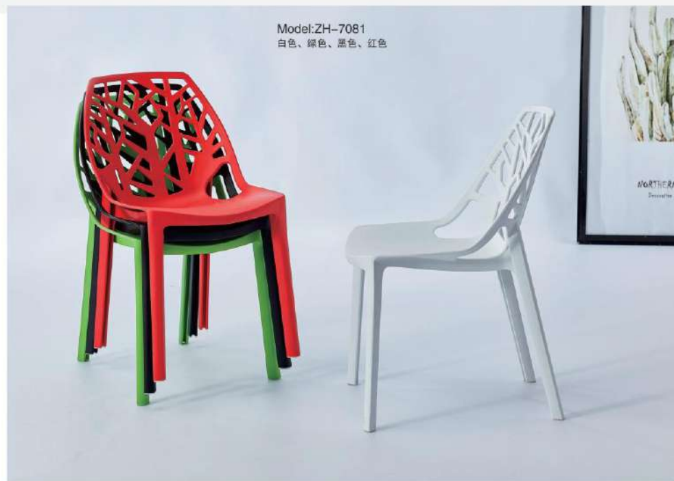
Model:ZH-7081 白色、绿色、黑色、红色