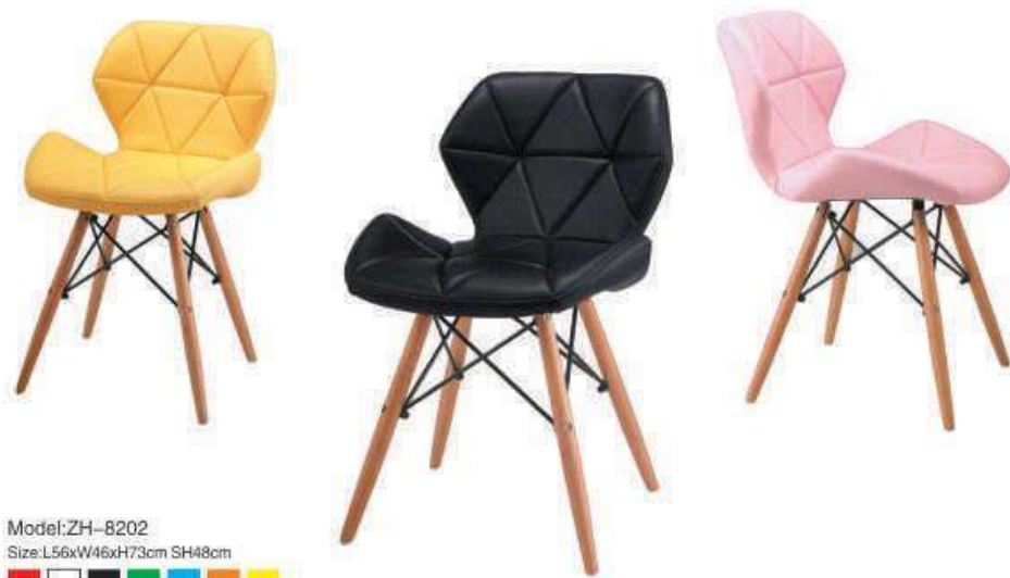
Model:ZH-8202 Size:L56xW46xH73cm SH48cm