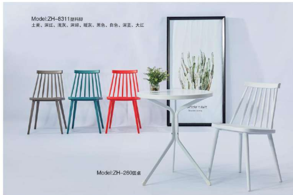
Model:ZH-8311 塑料脚 土黄、深红、浅灰、深绿、暖灰、黑色、白色、深蓝、大红