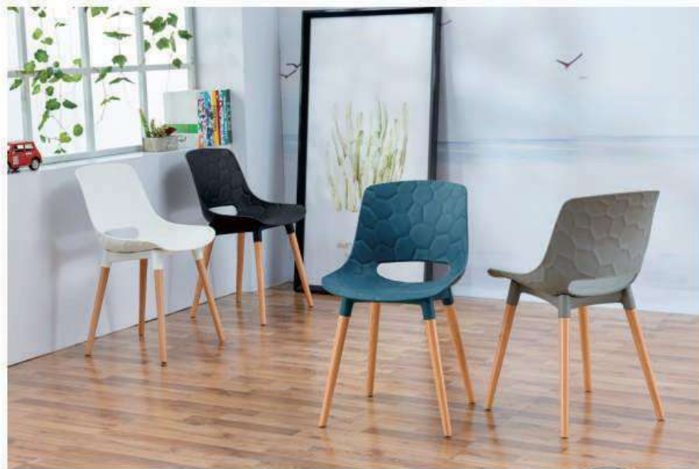
Model: ZH-194W 白色、黑色、深蓝、灰色