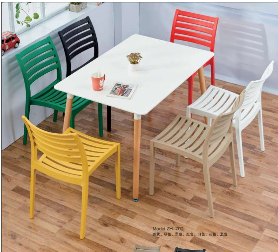
Model:ZH-700 姜黄、绿色、黑色、红色、白色、灰色、蓝色