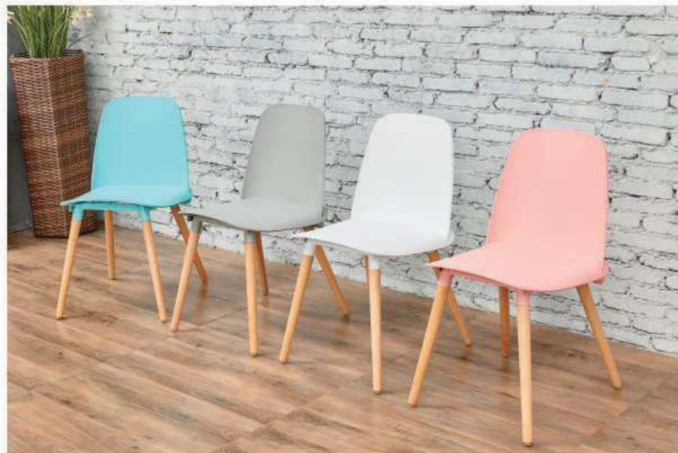
Model:ZH-8321A原木色脚 黑色、灰色、蓝色、粉色、白色、黄色