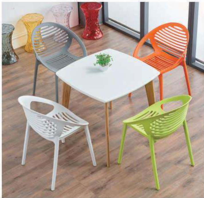
Model: ZH-8050 灰色、橙色、白色、深蓝、绿色、灰色