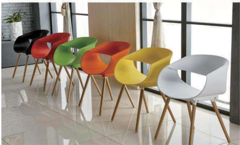
Model:ZH-7064 黑色、红色、绿色、橙色、黄色、白色