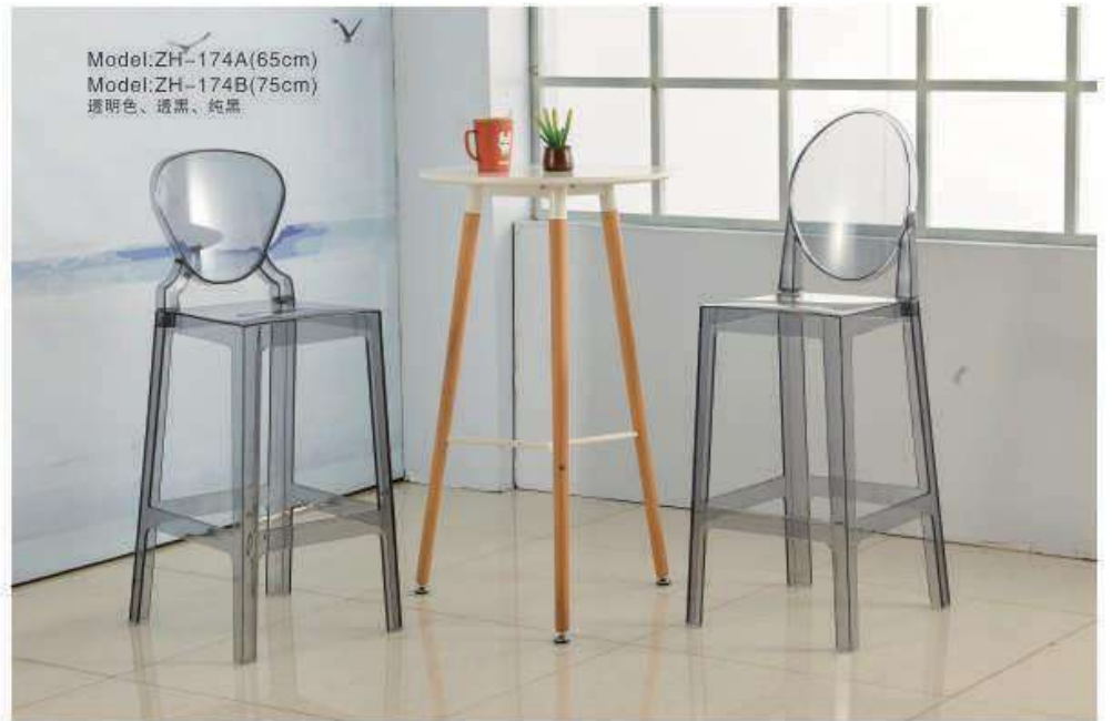
Model:ZH-174A(65cm) Model:ZH-174B(75cm) 透明色、透黑、纯黑