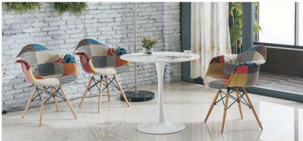
Model: ZH-8066D Size: L46xW64.5xP48xH80cm