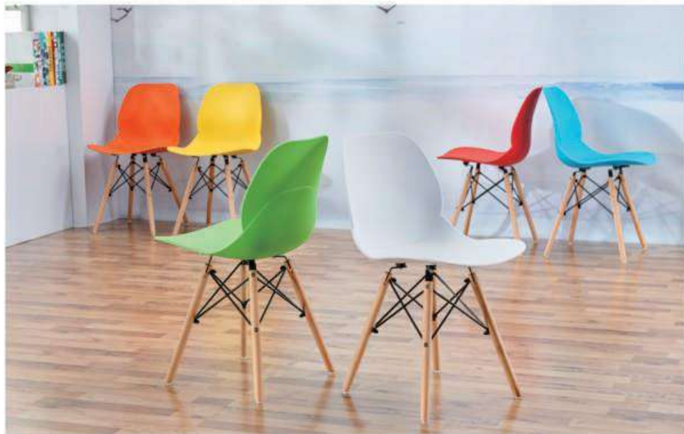
Model:ZH-346实木脚 棕色、黄色、绿色、白色、蓝色、红色、紫色