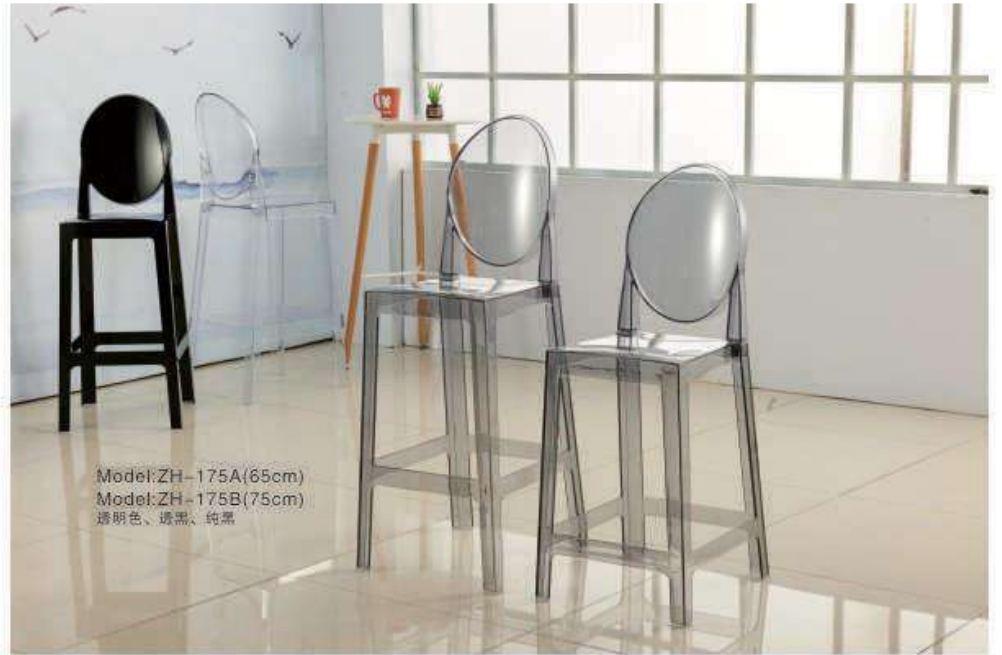
Model:ZH-175A(65cm) Model:ZH-175B(75cm) 透明色、透黑、纯黑