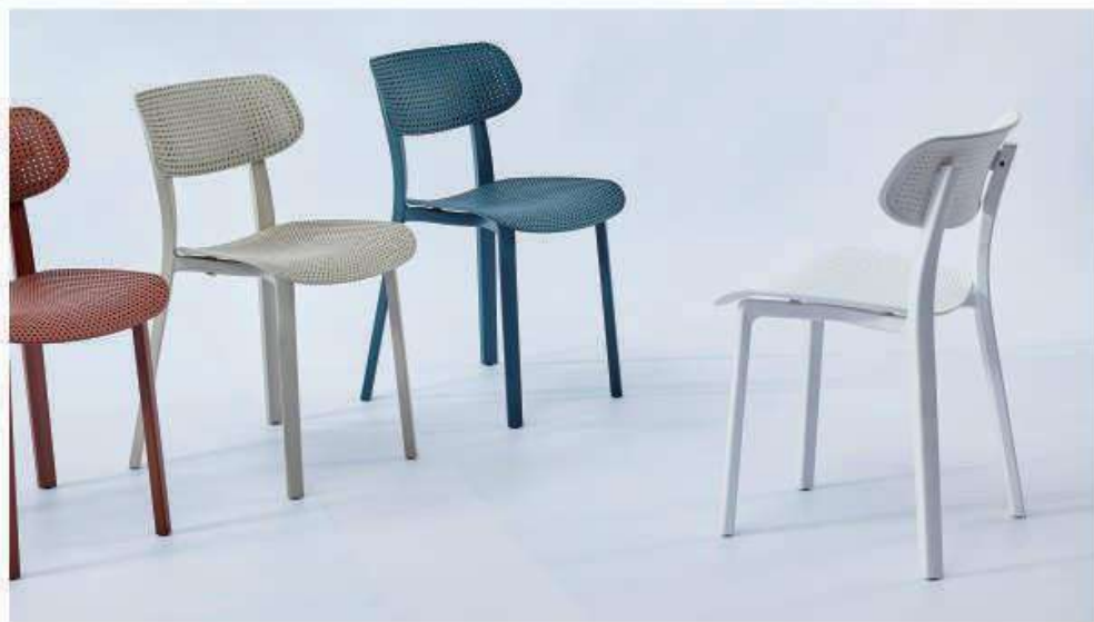
Model:ZH-096B 深红、灰色、深蓝、白色、黑色