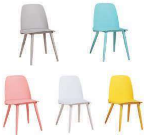
Model:ZH-8321A铁脚 黑色、灰色、蓝色、粉色、白色、黄色