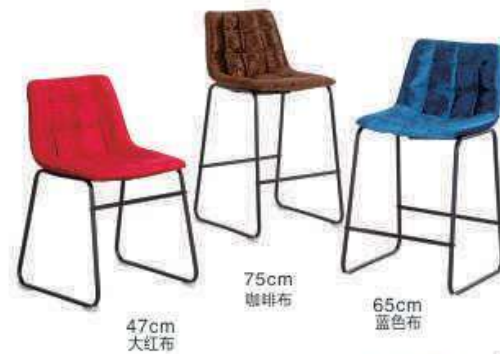
Model:ZH-8030 棕色、大红、深绿、深蓝