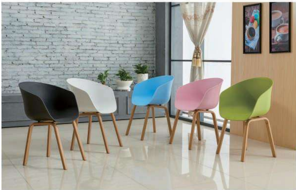
Model:ZH-8116铁脚 黑色、白色、蓝色、粉红、绿色