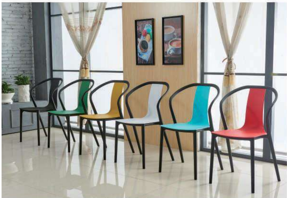
Model:ZH-8112 黑色、绿色、黄色、白色、蓝色、红色