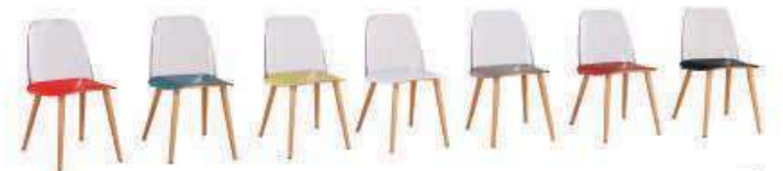
Model: ZH-237 凳子