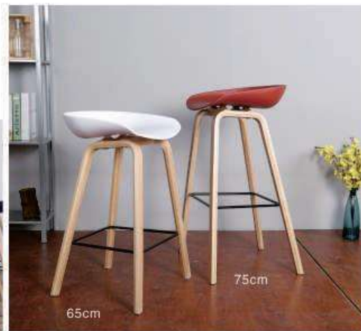
Model:ZH-8116H 深红、黄色、浅灰、白色、黑色