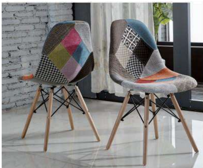
Model: ZH-8056C Size: 55x48x47cm

EXQUISITE THE EXQUISITE LINES AND ELEGANT STRUCTURES FORM THE UNCOMMON BEAUTY OF HOUSE.