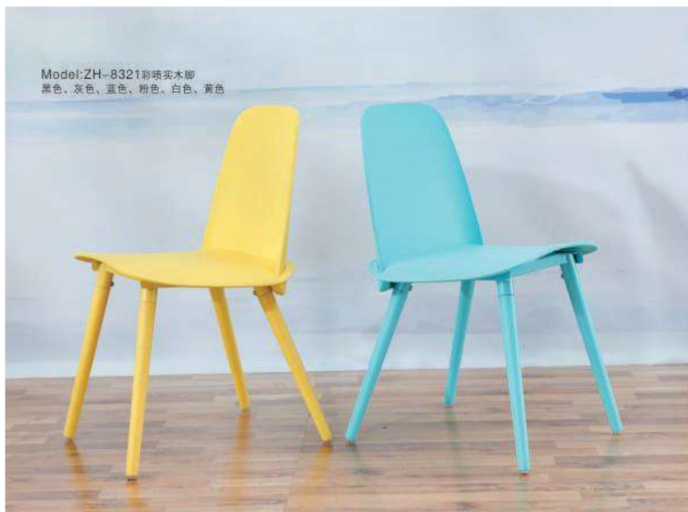
Model:ZH-8321彩喷实木脚 黑色、灰色、蓝色、粉色、白色、黄色