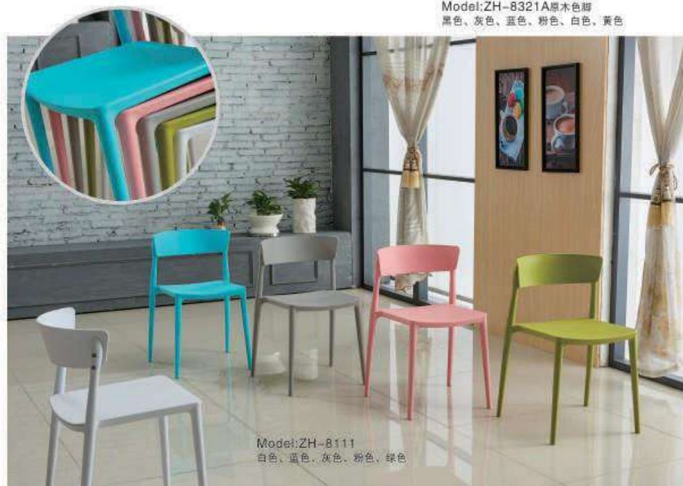
Model:ZH-8111 白色、蓝色、灰色、粉色、绿色