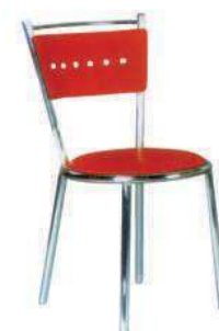
ZH-528七孔椅 红、黑、兰、橙、绿