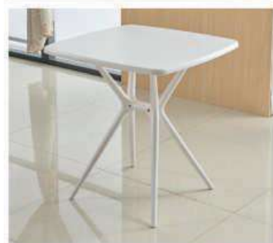
Model:ZH-4013 黄色、咖啡色、白色、黑色、藏兰色、驼色