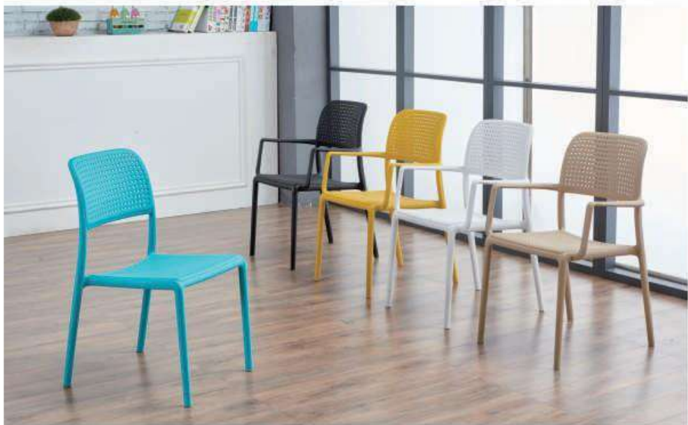
Model:ZH-695 (无扶手) 蓝色、黑色、黄色、白色、驼色