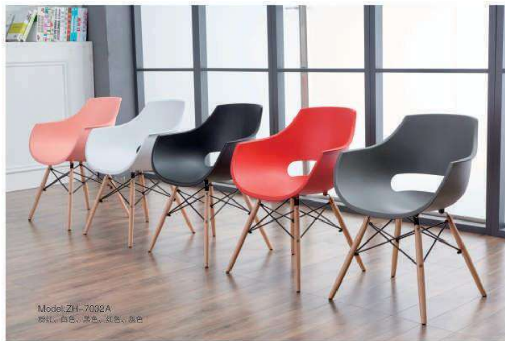
Model:ZH-7032A 粉红、白色、黑色、红色、灰色