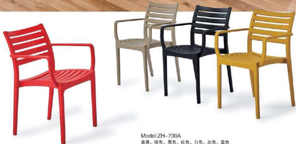
Model:ZH-700A 姜黄、绿色、黑色、红色、白色、灰色、蓝色