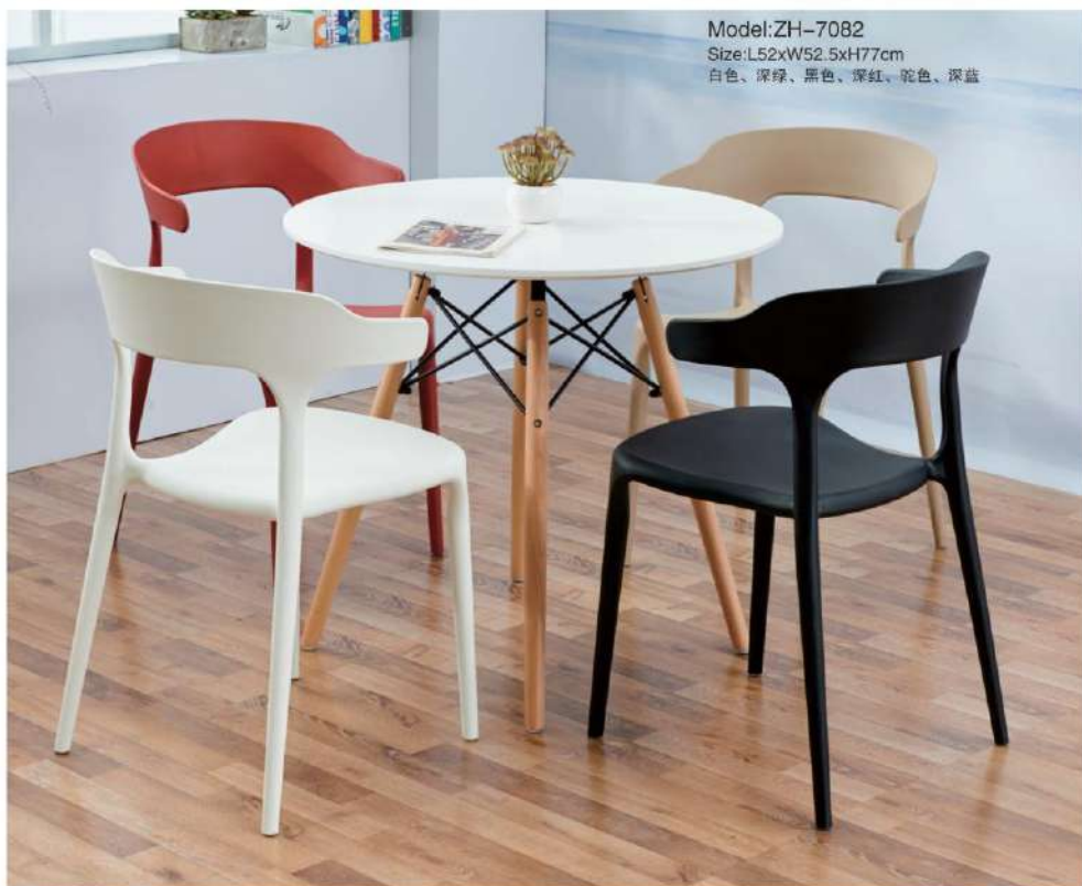
Model:ZH-7082 Size:L52xW52.5xH77cm 白色、深绿、黑色、深红、驼色、深蓝