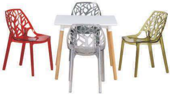
Model:ZH-812 Size:L57.5xW45.5xH81cm Sh45cm