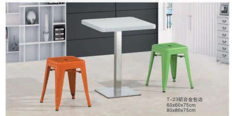
T-23铝合金包边 60x60x75cm 80x80x75cm