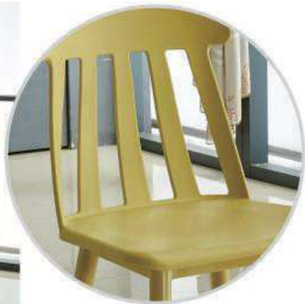
Model:ZH-8109 土黄、深绿、黑色、深红、白色、深蓝