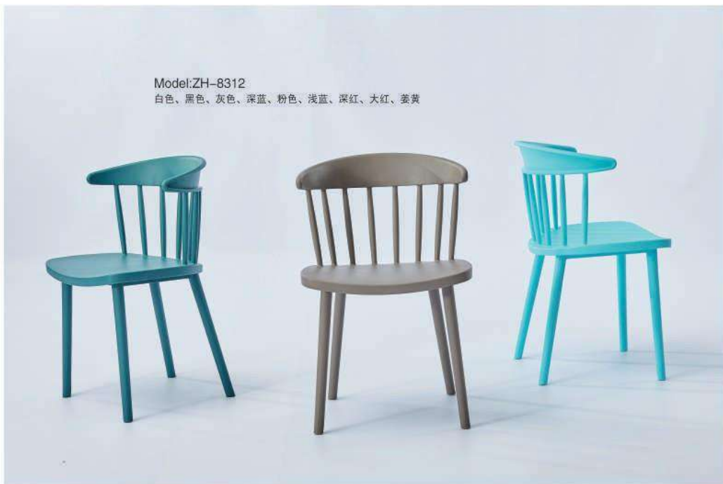
Model:ZH-8312 白色、黑色、灰色、深蓝、粉色、浅蓝、深红、大红、姜黄