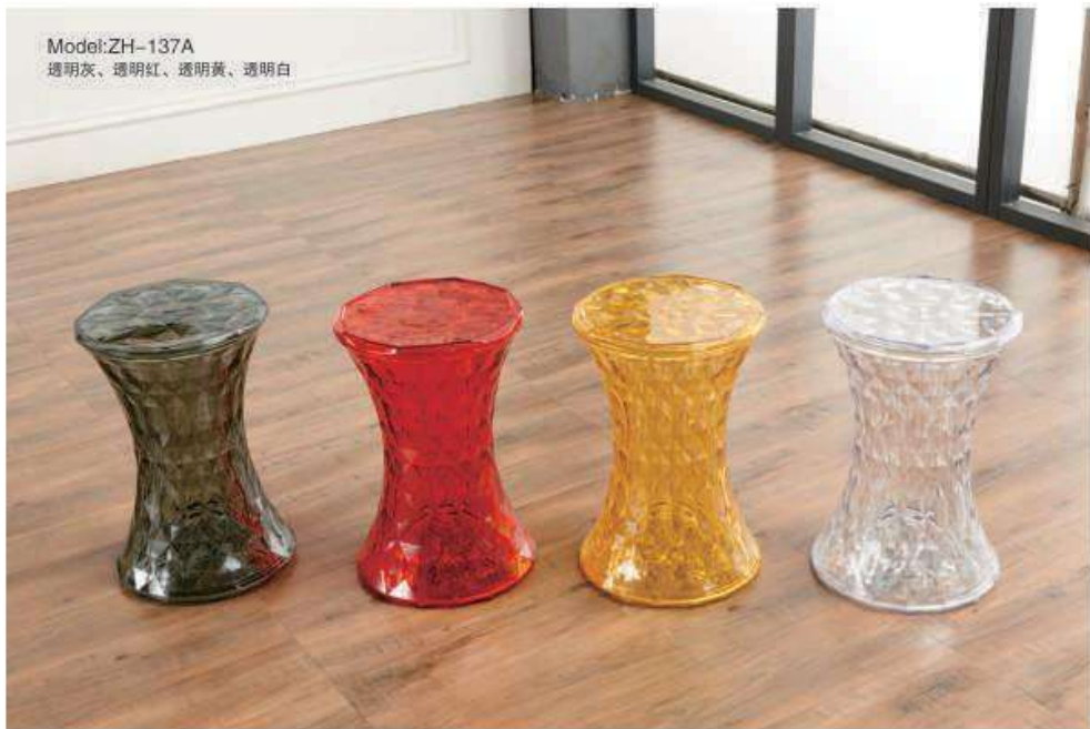
Model:ZH-137A 透明灰、透明红、透明黄、透明白