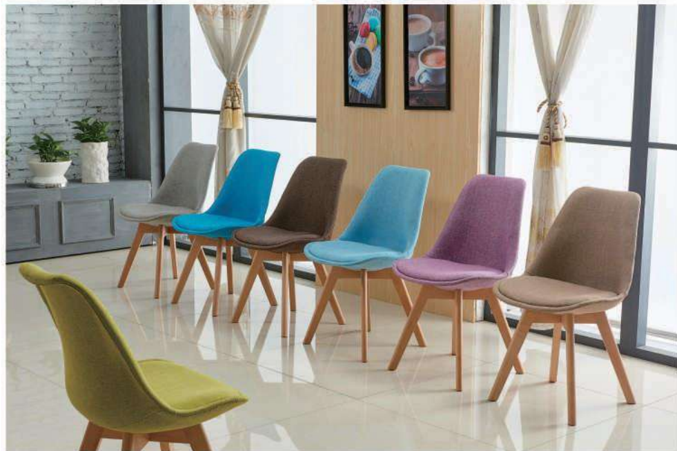
Model:ZH-8055布 绿色、浅灰、深蓝、深棕、浅蓝、紫色、浅棕