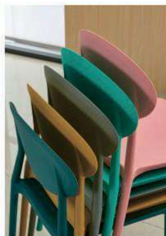
Model:ZH-8117 粉红、绿色、灰色、姜黄、深蓝、豆绿、白色