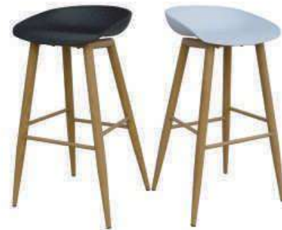
Model:ZH-7038B 黑色、白色、灰色、红色