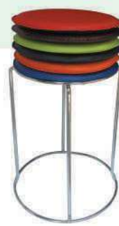
12厘皮面 红、黑、兰、绿、橙、咖