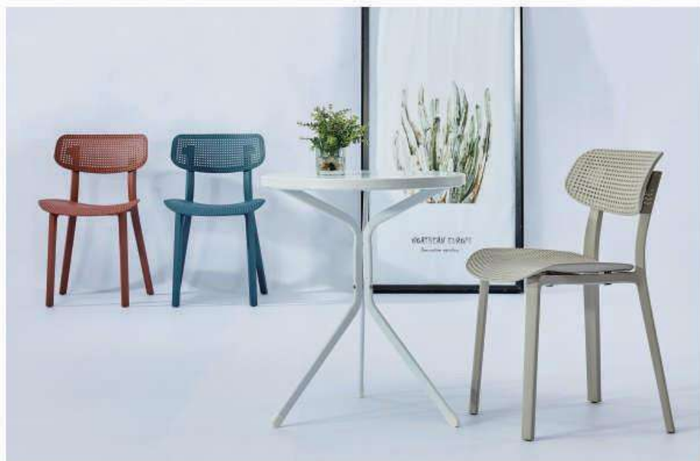
Model:ZH-260铁圆桌子 黑色、白色